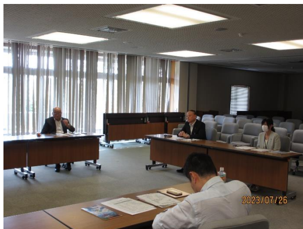
(長野県庁 北陸新幹線福井・敦賀開業に向けた取組について意見交換)