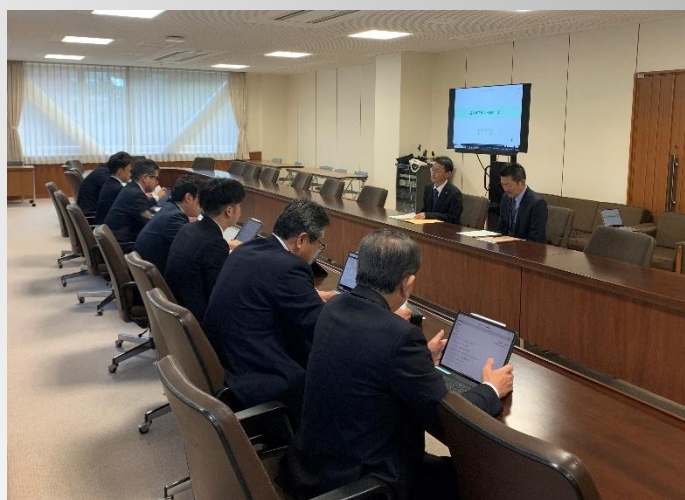
(福井県議会 関係課からブランド戦略(案)に関する説明の様子)