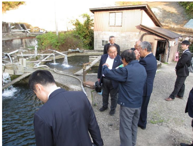
(被災した養殖場の復旧状況の視察)