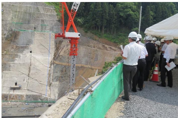
(吉野瀬川ダム 工事の進捗状況等の調査)