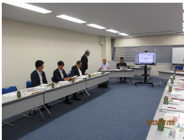
（（一社）埼玉県物産観光協会 物産販売促進等について意見交換）