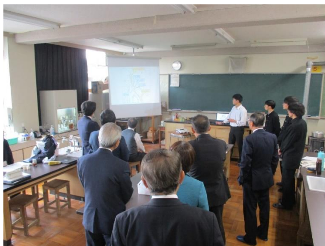
（福井県立武生高等学校における探究活動の結果報告）