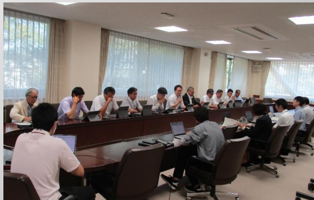
(人口減少対策について意見交換を行う様子)