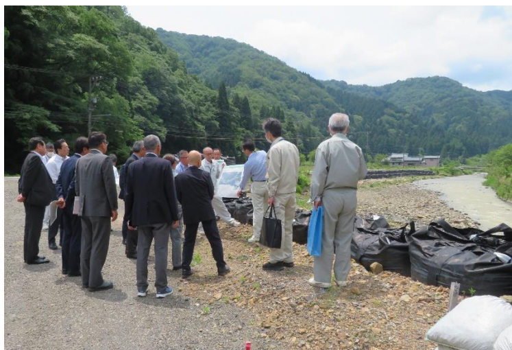
（南越前町令和4年8月大雨災害の復旧現場 復旧現場の状況等の確認）