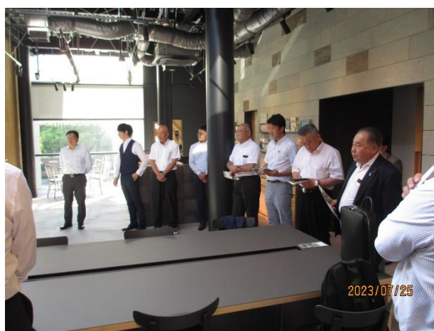
（東京都 ふくい南青山291の調査）