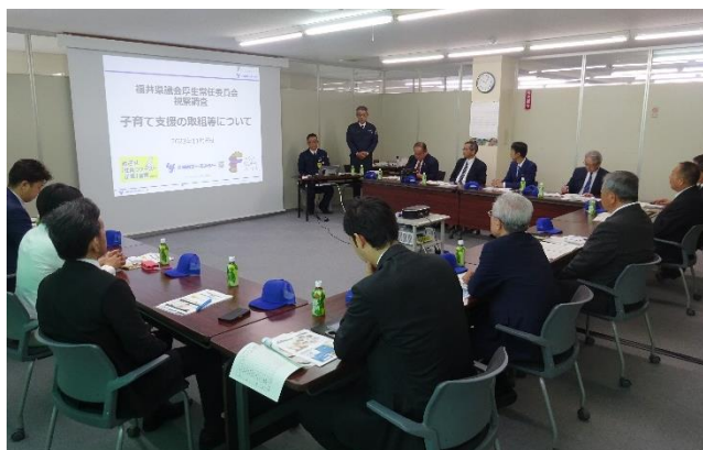
（株）日本エー・エム・シーにて子育て支援の取組等について意見交換）