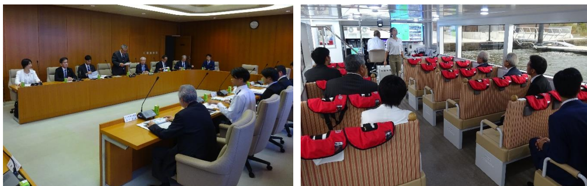
（美浜町役場、美浜町レイクセンターにてエネルギー政策について意見交換）