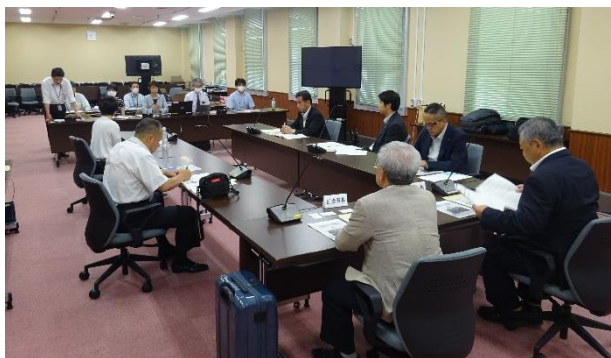
(大阪府にてフレイル対策の取組みについて意見交換)