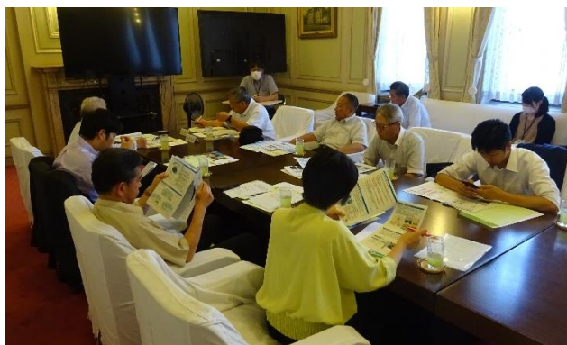
(静岡市にて脱炭素化に向けた取組みについて意見交換)