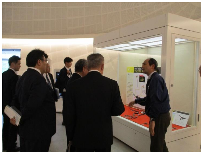
(リニューアル後の施設の視察)