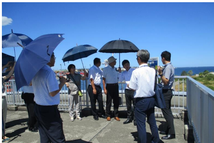
(新潟港 CNP 形成計画の策定に向けた検討、基地港湾指定までの取組等について調査)