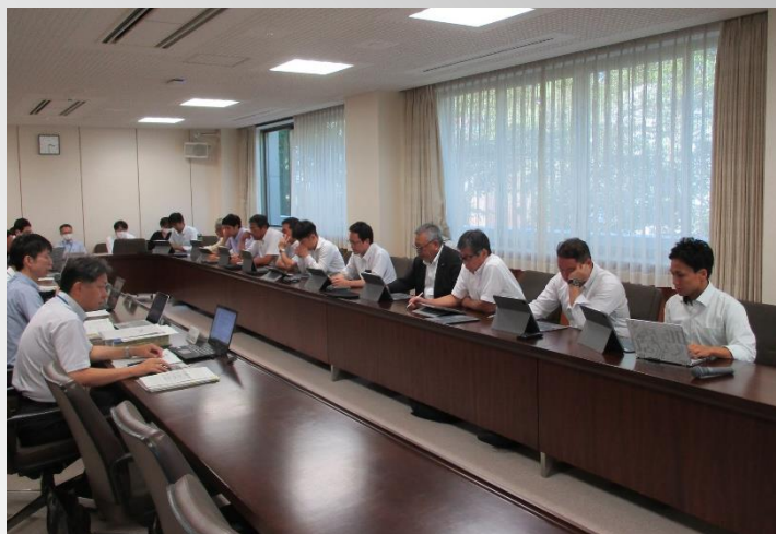
(福井県議会 関係課から自然減対策に関する説明の様子)