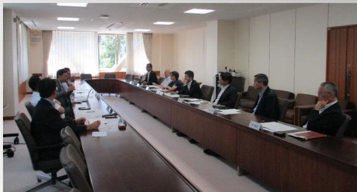
(建設人材の確保等について意見交換)