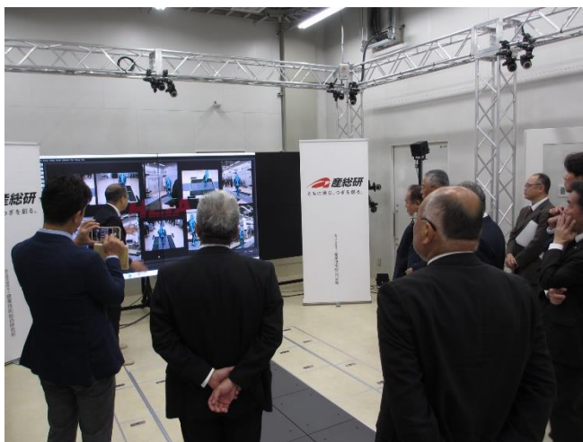
(北陸デジタルものづくりセンターの設備を視察)