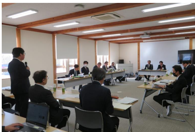
（福井県立大学での概要説明）