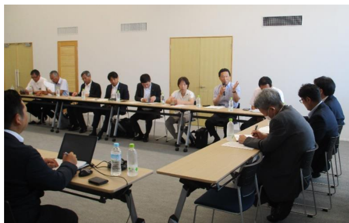
(加賀建設株式会社 建設産業の担い手確保等の取組について意見交換)