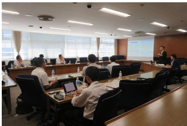
（広島県議会 不登校対策に関する説明の様子）