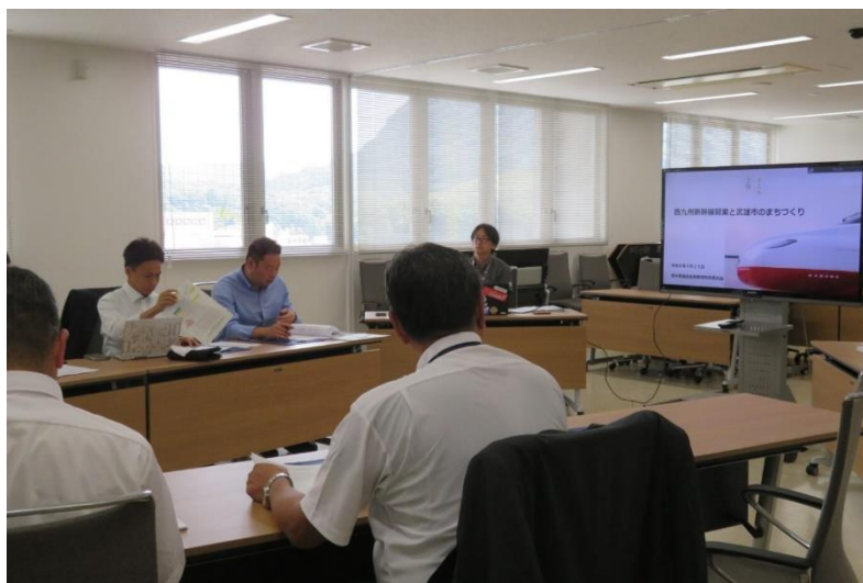
（武雄市役所 駅周辺のまちづくりに関する説明の様子）