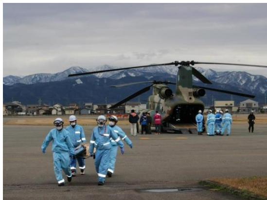
石川県輪島市の病院から患者30名を福井空港に搬送し、県内病院で受け入れ

寄付受付 件数 金額 福井県 241件 2,793,000円 あわら市 43件 472,500円 石川県 108件 2,085,000円 富山県 32件 289,000円