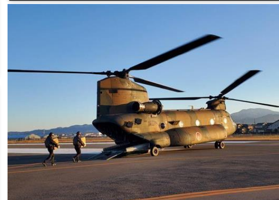
発災初期に緊急的に病院食をチヌークで珠州市に搬送