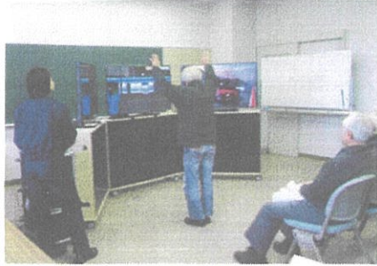
歩行環境シミュレーターを活用した交通安全教育