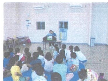
少年警察ボランティアによる防犯教室