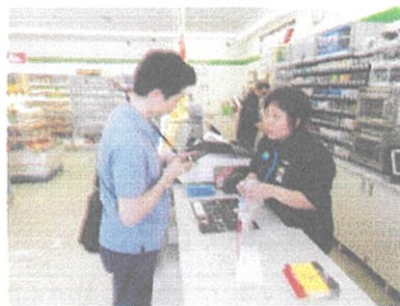
コンビニエンスストア での声かけ訓練