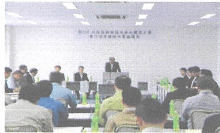
北陸新幹線建設工事暴排協議会