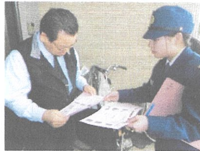
高齢者に対する訪問指導