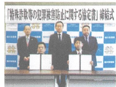
生命保険協会との協定