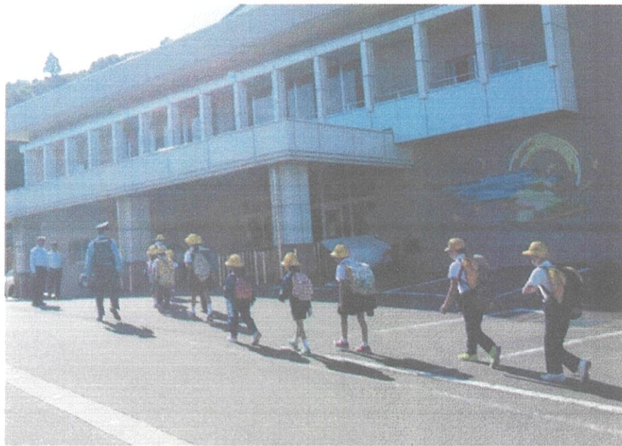
令和元年5月30日 集団登校時の同行警戒