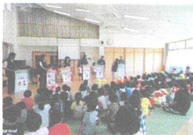
リュウピー防犯教室