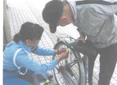
反射材普及・貼付活動