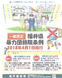
暴力団排除条例の一部改正