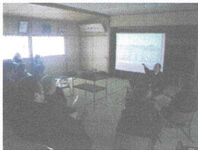
ドライブレコーダーを活用した交通安全指導