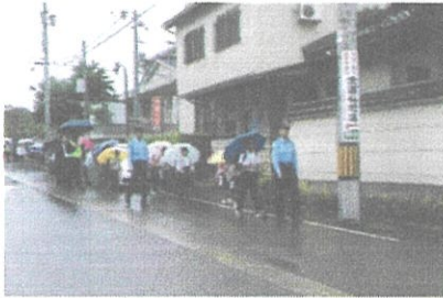
下校時の見守り活動 (子ども重点見守りデー)