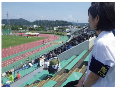
学生アスリートが利用する 競技場における不審者警戒