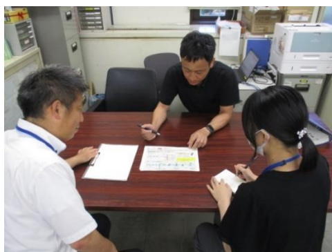
児童の安全確保に向けた 児童相談所との意見交換