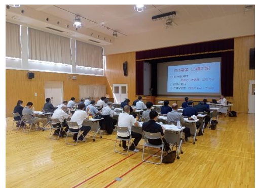
不当要求防止責任者講習