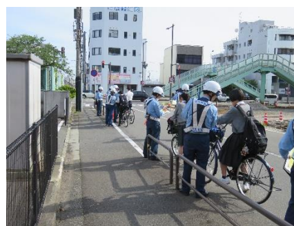
自転車利用者に対する一斉指導取締り