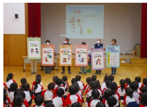
園児に「いかのおすし」を教える 子ども防犯教育