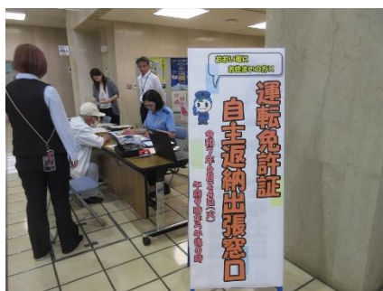
自主返納出張窓口の開設