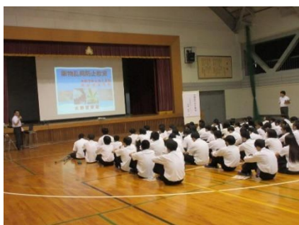
高校生を対象とした薬物乱用防止教室