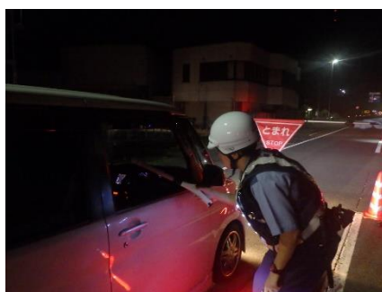
夜間における飲酒検問