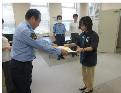
特殊詐欺被害の未然防止店舗への 感謝状贈呈