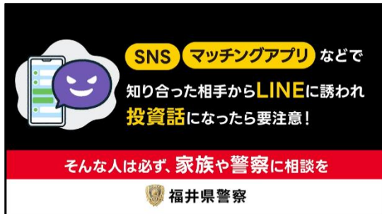
SNS型投資・ロマンス詐欺被害防止 に向けたターゲティング広告