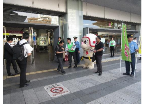
関係機関と連携した広報啓発活動