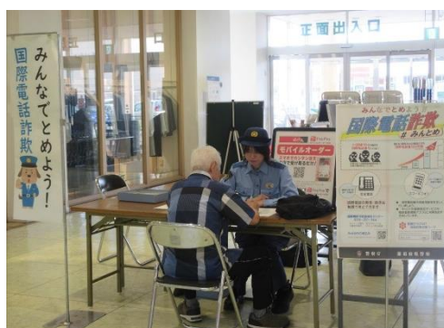
国際電話の利用休止出張窓口の開設