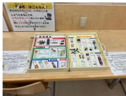
関係機関と連携した薬物乱用防止広報