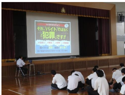
学校と連携した非行防止教室