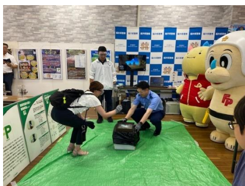
防犯ガラス効果の体験型講習