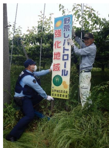
地域住民との合同パトロール