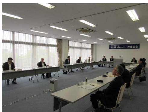
福井県暴力追放センター一定時評議員会