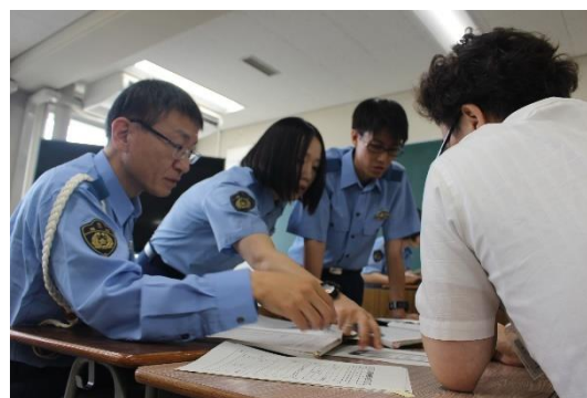
人身安全関連事案への対応訓練