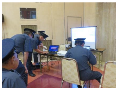
防犯隊員対象とした 体験型サイバー犯罪研修会