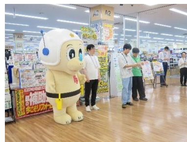
サイバー防犯ボランティア と連携した広報啓発活動