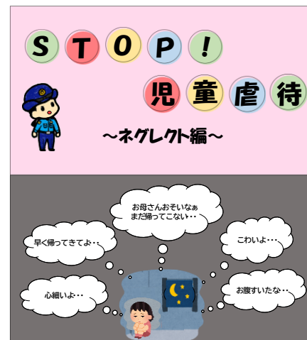
児童虐待防止に向けた SNSを活用した情報発信