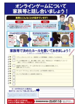
子どもがオンラインゲームをきっかけとして犯罪に巻き込まれるリスクに関する広報啓発