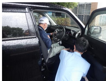
運転技能自動評価システムを活用した交通安全教育