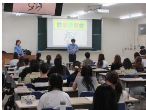
大学生を対象とした防犯講習会