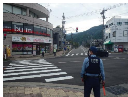
横断歩道における交通指導取締り