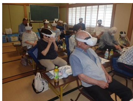
VRを活用したデジタル体験型安全講習