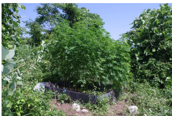
栽培されていた大麻草