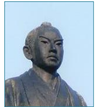
左内公園（福井市）の橋本左内立像

橋本左内、由利公正など、本県ゆかりの優れた先人がたくさんいますが、こうした方々の生き方や考え方について学ぶことができる読本を作成していきます。内容としては、業績や考え方、行動、逸話、転機となった出来事などを盛り込み、同時に、当時の時代背景・世情や人物相関、地理的な内容なども学べるようなものを想定しています。