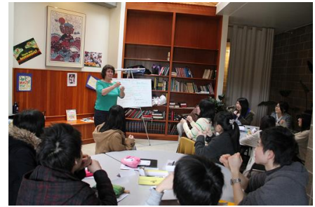
高校生語学海外研修の様子

指定56校の中に、本県から高志高校が選ばれました。また敦賀高校が、SGH事業をふまえた教育の開発・実践に取り組むSGHアソシエイト（全国で54校）として指定を受けました。県教育委員会でも、関係機関と連携しながら、各校の取組み支援を行っていきます。