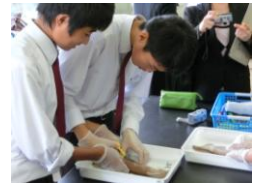
イカの外套膜の切開

先生の指示のもと、終始落ち着いた雰囲気の中で、子どもたちは協力しながら集中して実験を進めることができていました。