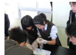
イカの消化管の観察