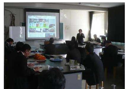
理科教員の研修会の様子

教員自身が専門分野の知見を拡げ専門性を高めることによって、最先端の知識を伝え、生徒の興味関心を喚起し、将来の日本や本県の産業を支える人材の育成につなげていってください。