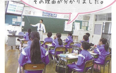
保安林について説明

なぜ海岸線にマツの木が植えられているのかわからなかったけれど、その理由が分かりました。