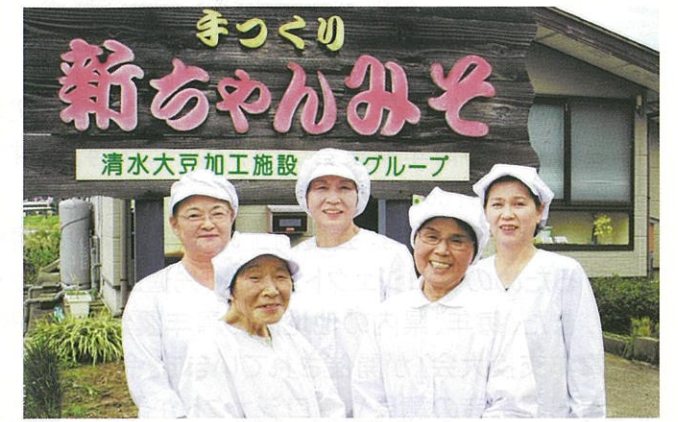
「新ちゃんみそ」メンバー