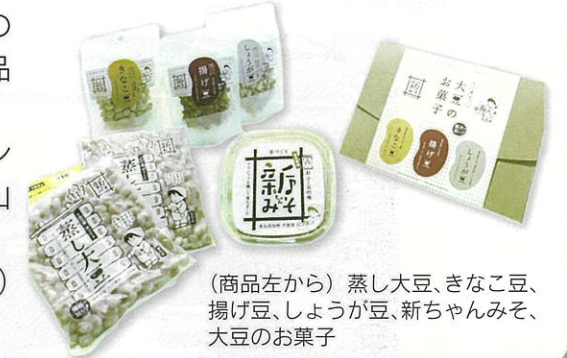
(商品左から) 蒸し大豆、きなこ豆、揚げ豆、しょうが豆、新ちゃんみそ、大豆のお菓子