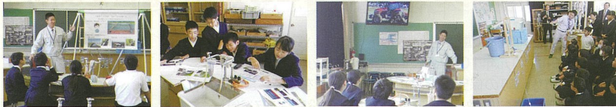
最先端に行く 福井の農業を説明