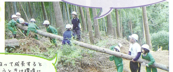
間伐木の重さを体感

木は二酸化炭素を吸って成長すると聞いたので、家を買うときは環境に優しい木を使った家を買いたいです。