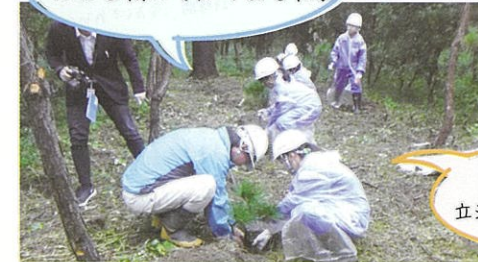
抵抗性アカマツを植栽

私たちが植えたマツの木が大きく育って、立派な保安林になってくれることを願っています。