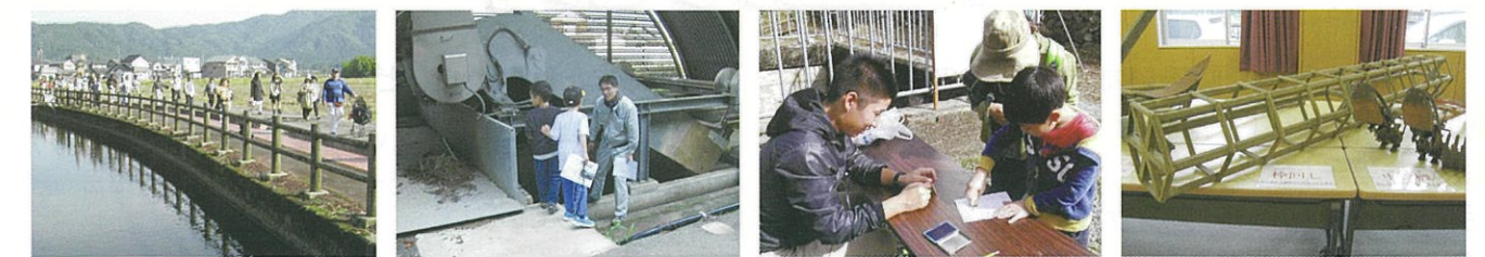
自由散策(徳光用水路)

今年度は、スタンプラリーやクイズなどのゲーム的要素と、昔の農具の展示といった文化的要素を新たに追加し、子どもやリピーターの方も楽しめるよう工夫しました。当日は好天に恵まれ、家族連れを中心に約100人が、用水周辺の自然や歴史を楽しみながら、約5キロのコースを巡りました。