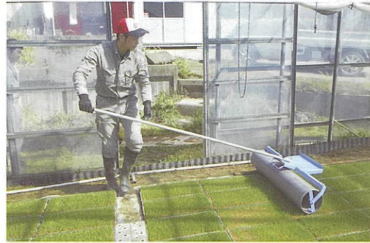
プロジェクト活動による新たな技術の実証 (育苗技術と土壌改良資材の検討)

さらに、令和2年11月には「2020年度全国農業青年交換大会in 福井」が開催され、全国から約300名の青年農業者が参集する予定です。全国各地の青年農業者との意見交換や交流を深め、福井の青年農業者やクラブの活動がより一層盛り上がることを期待しています。