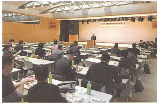
福井県農業青年交換大会

また、毎年、県内の他地区の青年農業者との情報交換や交流を行うことを目的に、「福井県農業青年交換大会」が開催されています。令和2年1月31日に福井地区において開催された大会では、青年農業者の意見やプロジェクトが発表されたほか、県内外の農業関連資材メーカーによる展示、相談会が行われました。