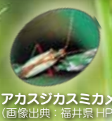
アカスジカスミカメ