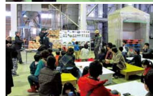
農楽祭(平成27年12月19日)