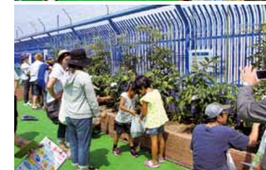
西武で開催された親子屋上菜園(平成27年夏)