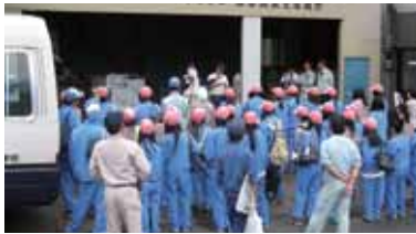
ニンニクについての説明