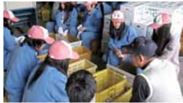
玉割り作業の方法