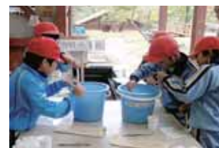
パックテストを使用した水質試験