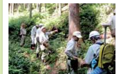
美山町森林組合と合同で行った作業道の調査