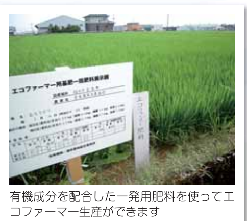
有機成分を配合した一発用肥料を使ってエコファーマー生産ができます

エコファーマーは5年かけて新しい生産方式に移行する制度ですが、できれば2～3年でエコ肥料等の生産方式を普及していきたいと考えています。しかし、まず最初に生産者の皆さんにエコファーマーに取り組む意思表示(申請)をしていただかなければ始まりません。来年3月までにJAを窓口として申請できるよう全県的に準備を進めていきますので、ご協力をお願いします。