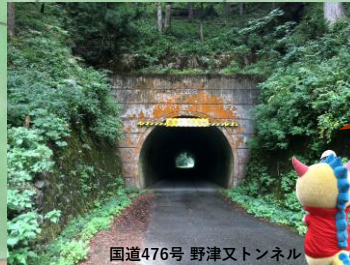
国道476号 野津又トンネル