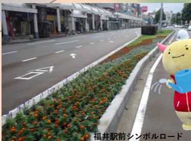
福井駅前シンボルロード