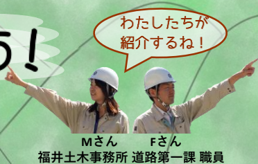
Mさん Fさん 福井土木事務所 道路第一課 職員

土木って、ぼくたちの安全や自然を守っているんだよ。身近なものをいっしょに見てみよう！