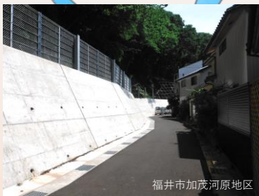
福井市加茂河原地区