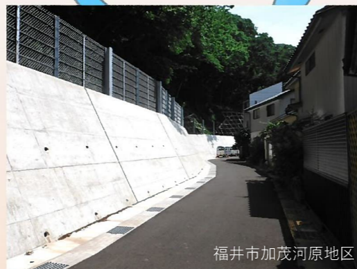
福井市加茂河原地区