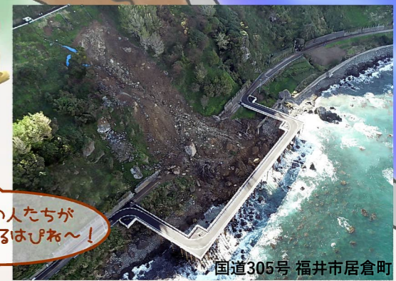
さいがいふっきゅう 災害復旧