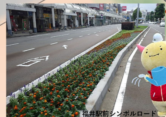
福井駅前シンボルロード

土木って、 ぼくたちの安全や自然を守っているんだよ。 身近なものをいっしょに見てみよう！