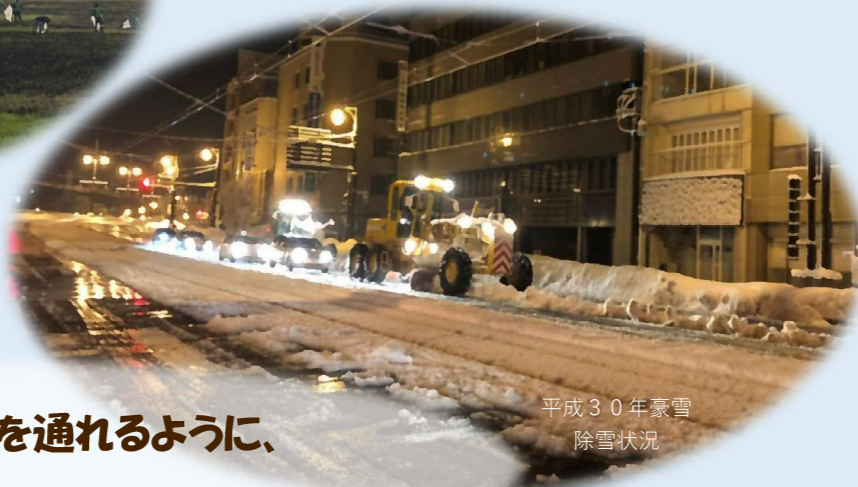
平成30年豪雪 除雪状況