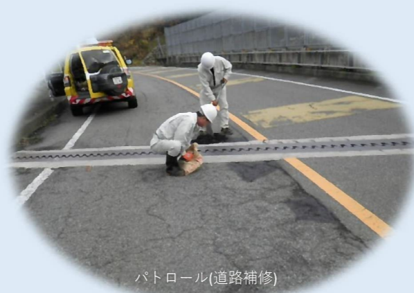
パトロール(道路補修)