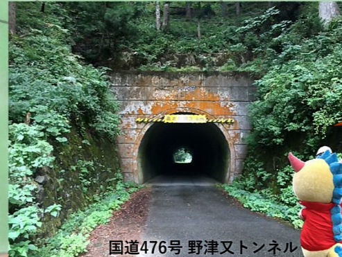
国道476号 野津又トンネル