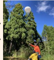
ルーターを搭載したハルーン

林業の効率化を図るため、航空レーザー計測を行い、間伐が必要な森林の抽出や現地調査の省力化等を進めています。ある森林組合では、施業地確保に要する時間を約4割削減することができました。また、携帯圏外の森林で通信環境を整備する実証を進め、林業従事者の就労環境改善に向けた挑戦をしています。