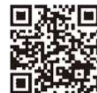
認証キーの取得方法 発注者への提出方法