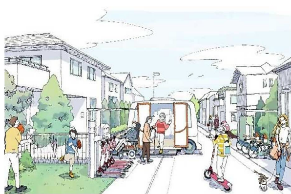
マイカーを持たなくても便利に安心して移動できる モビリティサービス