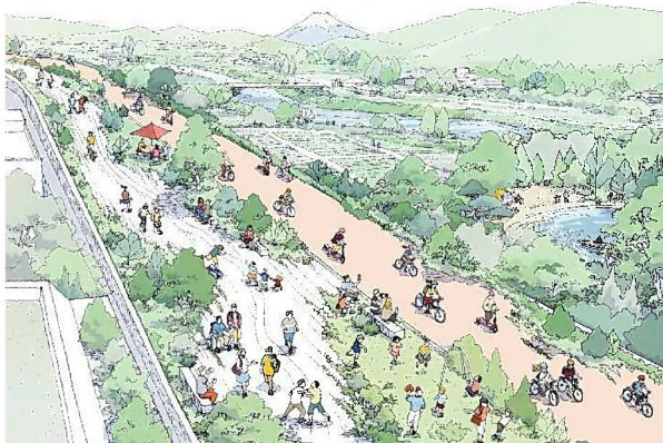
公園のような道路