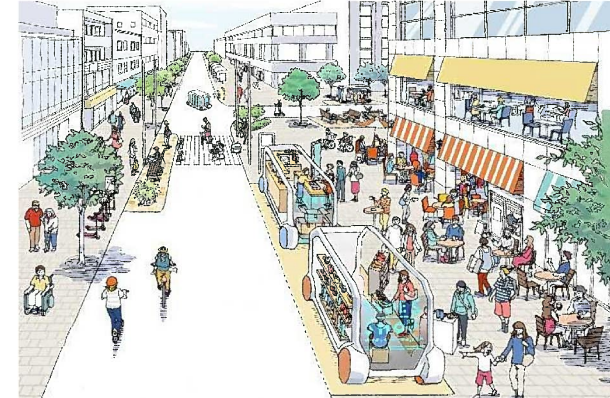
店舗（サービス）の移動