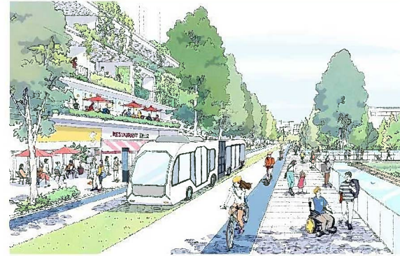
BRT(バス高速輸送システム)や自転車等を中心とした低炭素な交通システム