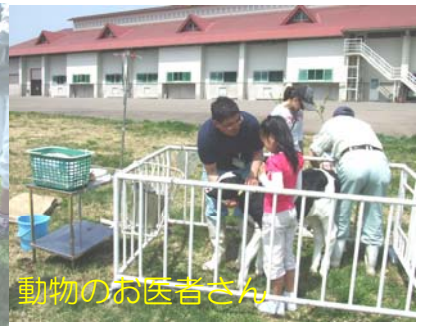
動物のお医者さん