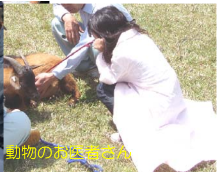
動物のお医者さん