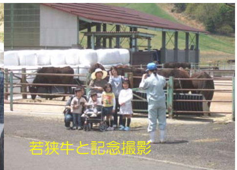
若狹牛と記念撮影