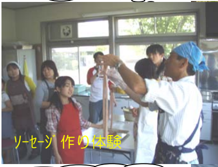
ソーセージ作り体験