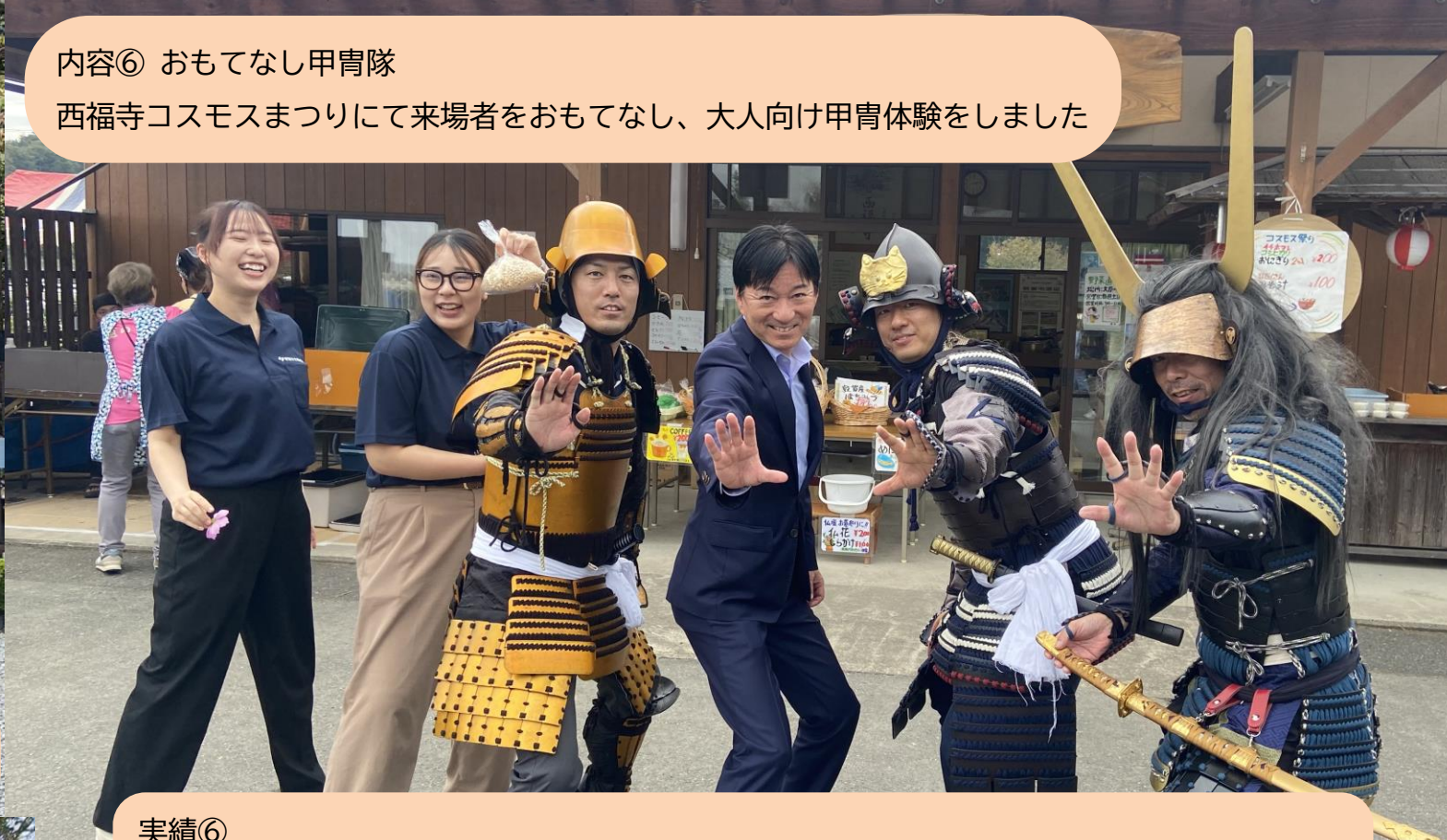
内容⑥ おもてなし甲冑隊 西福寺コスモスまつりにて来場者をおもてなし、大人向け甲冑体験をしました

実績④ 2024年10月12日～13日（丸岡城跡）EXP0当日は会場内、野外ステージで来場者のおもてなしやイベント司会参加、EXP0当日の朝はNHK「ウイークエンド中部」にて開催レポートの収録と放送 10月1日はEXP0告知イベントにて武将舞を披露、地方民放2局、NHKにて放送されました