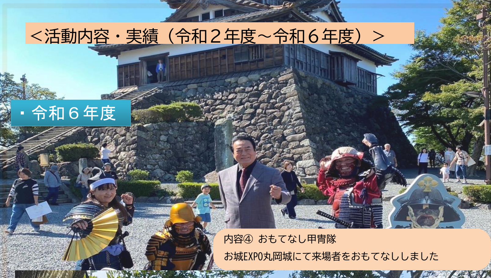
内容④ おもてなし甲冑隊 お城EXP0丸岡城にて来場者をおもてなししました

実績④ 2024年10月12日～13日（丸岡城跡）EXP0当日は会場内、野外ステージで来場者のおもてなしやイベント司会参加、EXP0当日の朝はNHK「ウイークエンド中部」にて開催レポートの収録と放送 10月1日はEXP0告知イベントにて武将舞を披露、地方民放2局、NHKにて放送されました