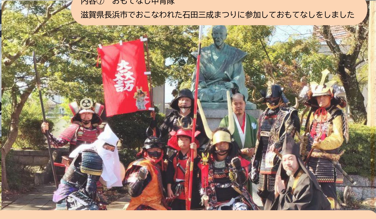
内容⑦ おもてなし甲冑隊 滋賀県長浜市でおこなわれた石田三成まつりに参加しておもてなしをしました

実績⑤ 2024年10月22日（国吉城跡）寸劇をして観客を楽しませるおもてなしをしました 新規メンバー 1名獲得