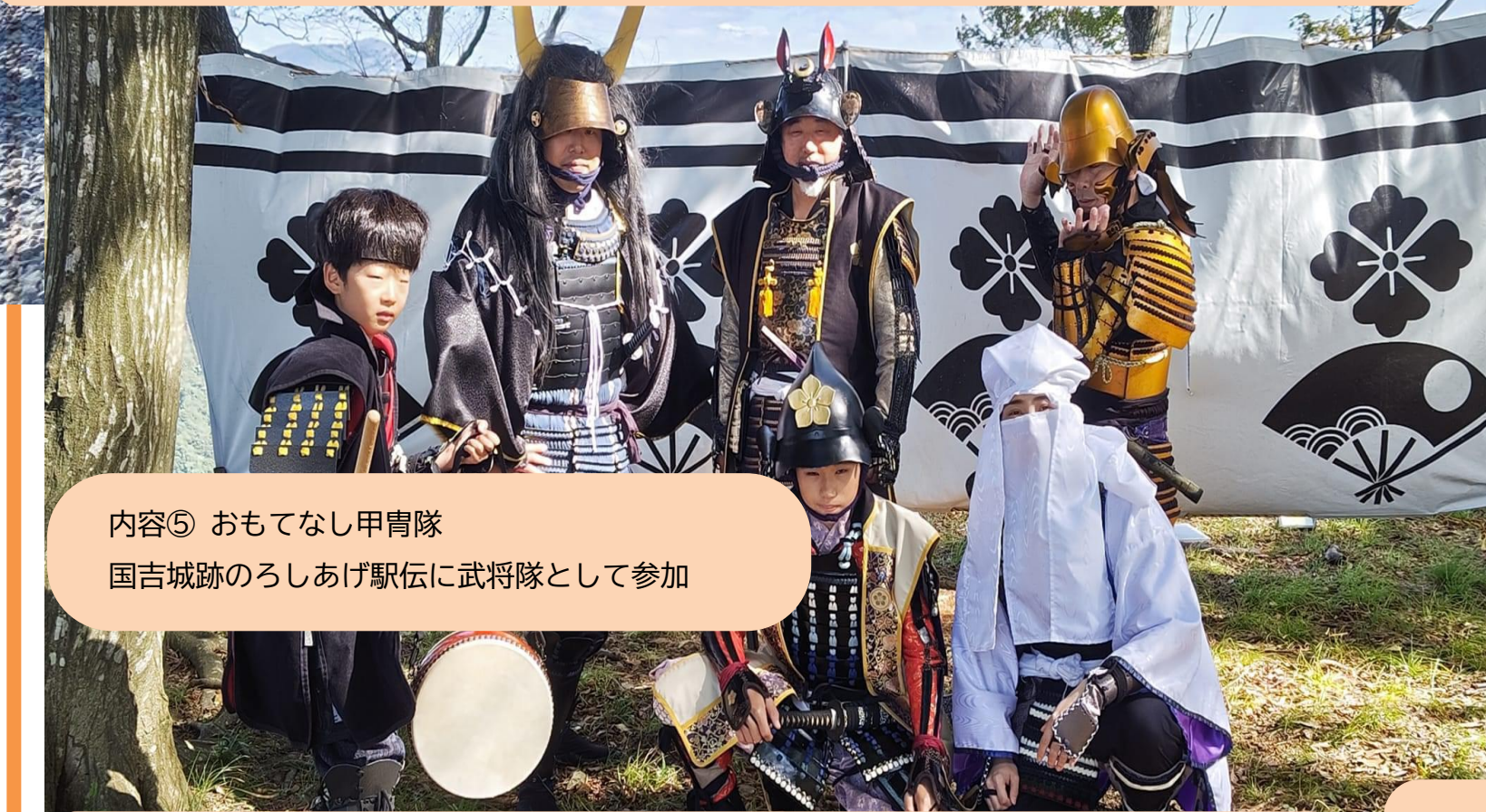
内容⑤ おもてなし甲冑隊 国吉城跡のろしあげ駅伝に武将隊として参加

実績⑥ 2024年10月27日（西福寺）甲冑体験と甲冑姿でおもてなし体験コーナーをしました 甲冑体験 大人 5名