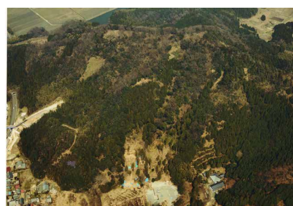
若狭国吉城址全景