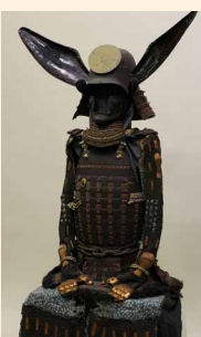
いよねだんがえにまいどうくそく 伊予札段替二枚胴具足 (田辺半太夫家旧蔵)