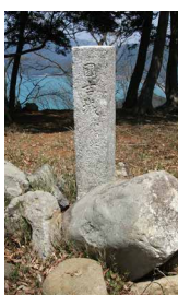
本丸跡に建つ 国吉城址碑

もし、国吉籠城戦で国吉城が落城していたら、織田軍の朝倉攻めも違ったものとなっていただでしょう。粟屋勝久の活躍と国吉籠城戦の結果がもたらしたその後の歴史への影響