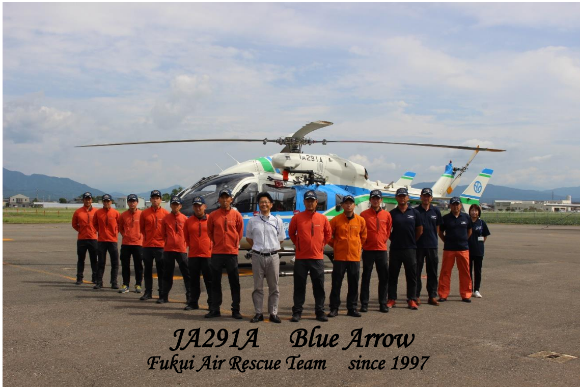
JA291A Blue Arrow Fukui Air Rescue Team since 1997