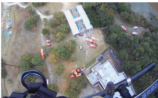
緊急消防援助隊近畿ブロック合同訓練