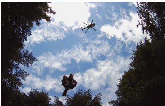
自隊訓練（山岳救助）