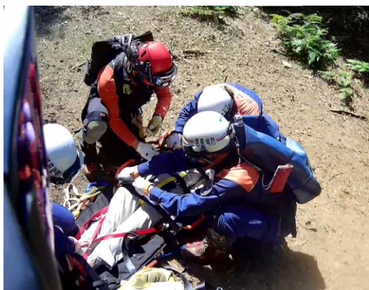
消防隊員との連携訓練