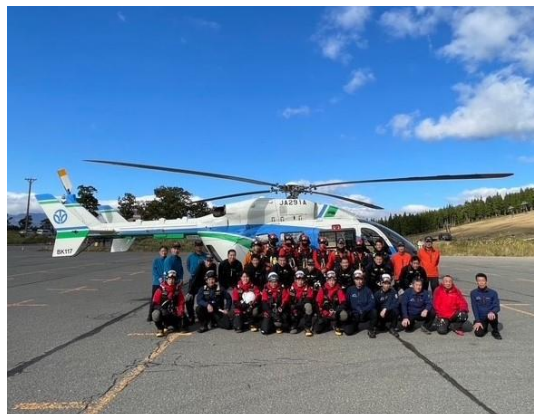
北陸三県合同訓練