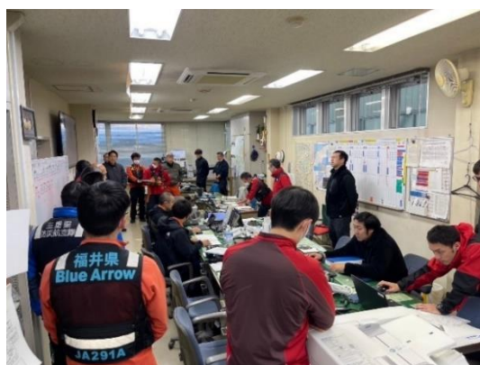
令和6年能登半島地震