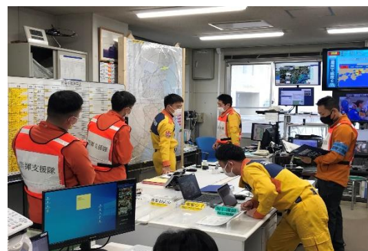
緊急消防援助隊中部ブロック合同訓練