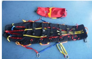
パーティカルストレッチャー