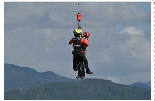
サバイバースリング