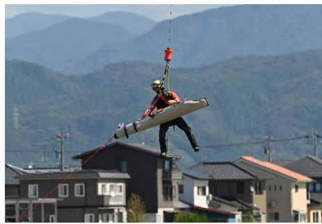
パーティカルストレッチャー