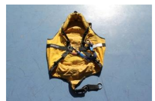
エバックハーネス