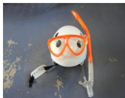
ヘルメット・シュノーケル