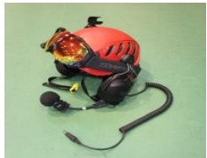
航空救助用ヘルメット