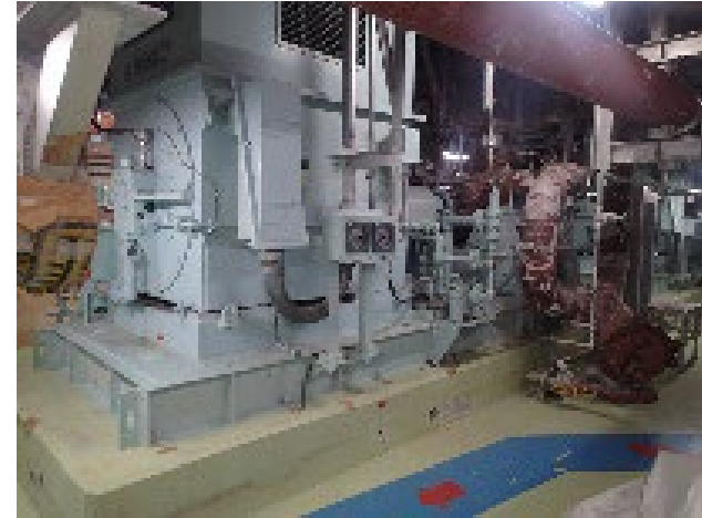
[原子炉給水ポンプ（3台）]