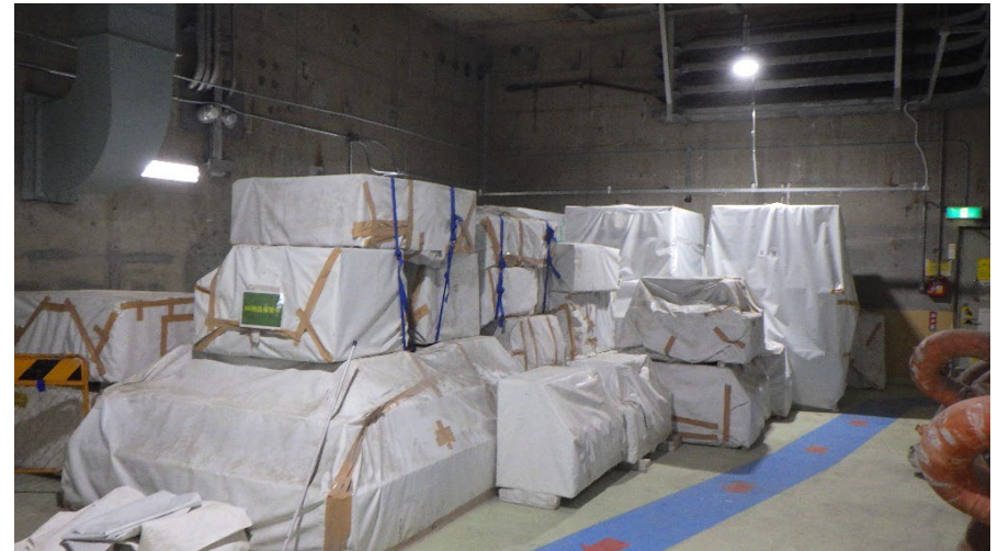
基礎コンクリート等の保管状況の写真