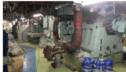
[原子炉給水ポンプ]