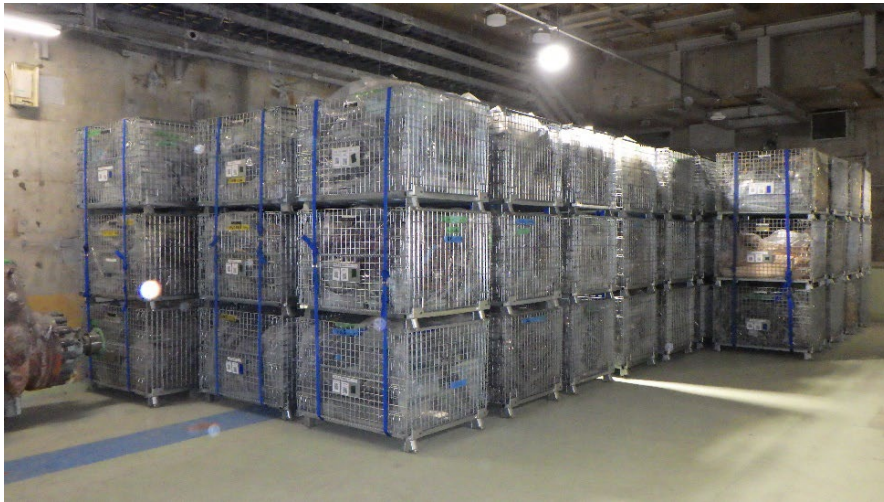
放射性廃棄物の保管状況の写真