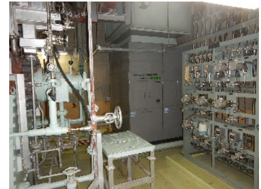
[原子炉給水ポンプ室空気調和器]