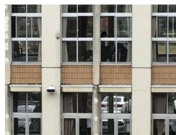
学年ホールを中心に集まる生徒