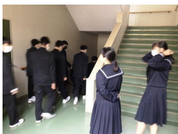
下級生を優先し、自分たちは待機する3年女子生徒