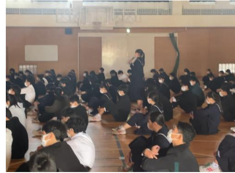
【生徒が質問に答えている様子】