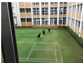
中庭で放送を聞き中心部に移動する女子生徒