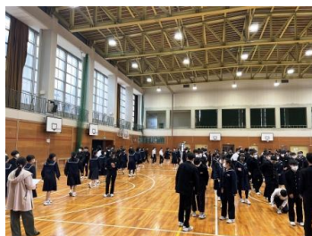
体育館での集合の様子