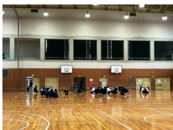
体育館にいた教員の指示を聞いてしゃがむ生徒