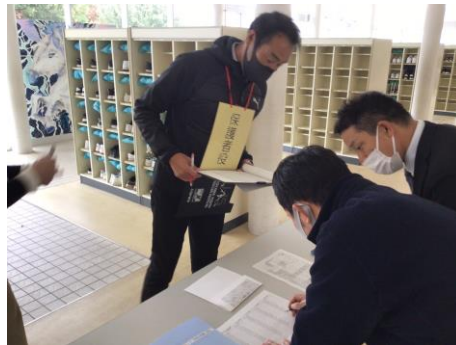
【保護者役の教員が生徒を迎えに来て、学年主任と副主任が対応している様子】

垂直避難訓練と同様、引き渡し訓練も本校では初めての試みであった。今回は垂直避難をしてからの引き渡しを想定し、生徒は教室で待機していた。遠隔での連携の必要性から、トランシーバーを使って連絡を取り合うなど、その場で気づいた教員が臨機応変に対応することができた。