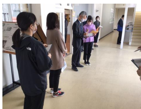
【各学年主任が教頭に人数を伝えている様子】