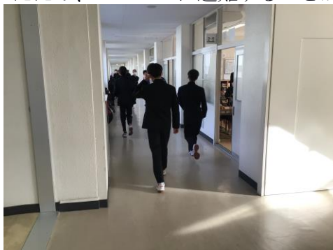
【生徒が速やかに自教室に避難する様子】

本校では、今回初めての垂直避難訓練を行った。地震・火災の避難と異なり避難場所は自教室を設定した。担任からあらかじめ垂直避難の方法について事前指導していたため、スムーズに避難することができた。