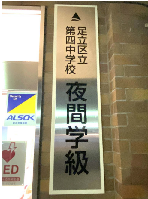
10クラス 6クラスは外国人 少人数クラス (最大6人)