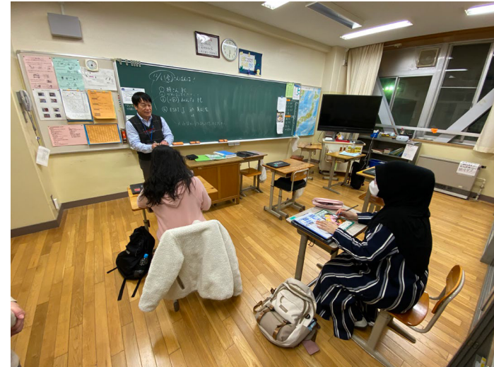
ヒシャブを着けた方もいました。