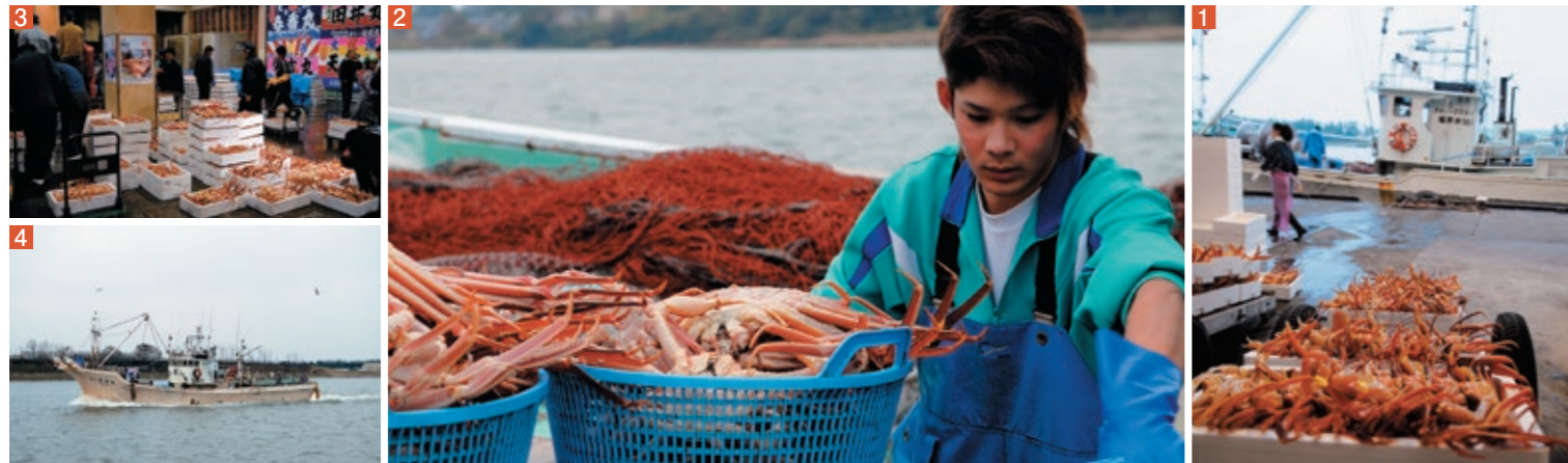
独特の緊張感と活気に満ち溢れる、初セリ会場。