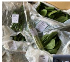
←季節の 野菜セット