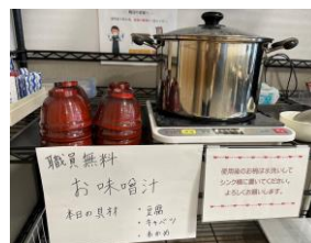
(味噌汁の無料提供)