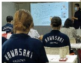
(セミナー開催風景)