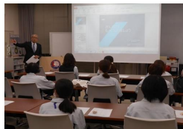
（↑セミナー開催風景）