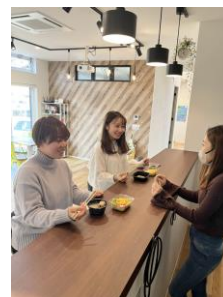
（設置型社食で コミュニケーション）