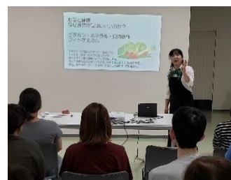
（野菜ソムリエプロによる講演）