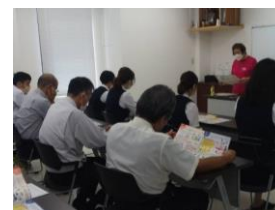
(食生活改善講習会の様子)