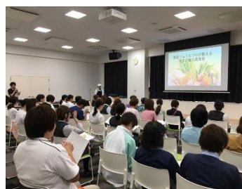
（野菜ソムリエプロによる講演）