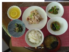
(県産農産物を使用した社食)