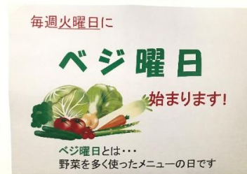
（社食に掲示しているベジ曜日のポスターと実際のメニュー）