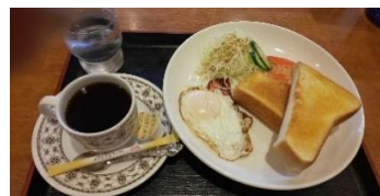
(↑モーニングセット)