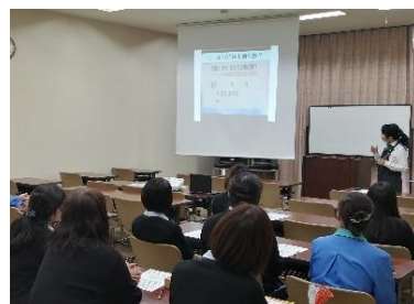
(野菜ソムリエプロによる講演)