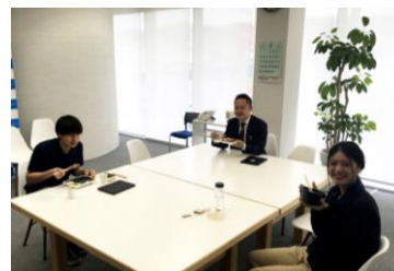
（シャッフルランチ）