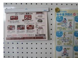
（健康に配慮した飲食物提案）