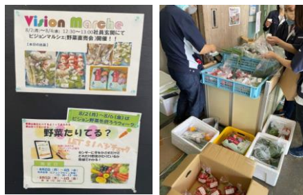
(ビジョンマルシェ)