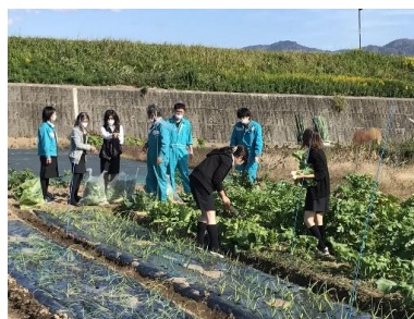
（↑クボタふれあい菜園）