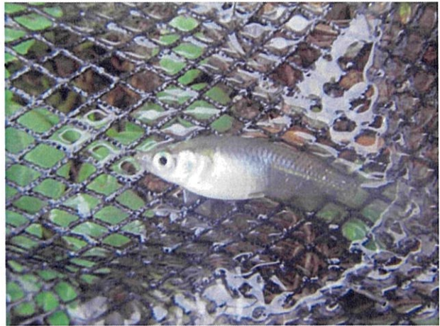
水路で確認されたメダカ