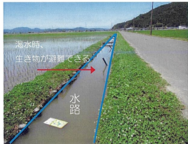
生き物緩衝地帯の水路と水田（鯖江市）

取組区には、右の写真のような水路が設置されているので、濁水時に生き物の避難場所になると考えられる。