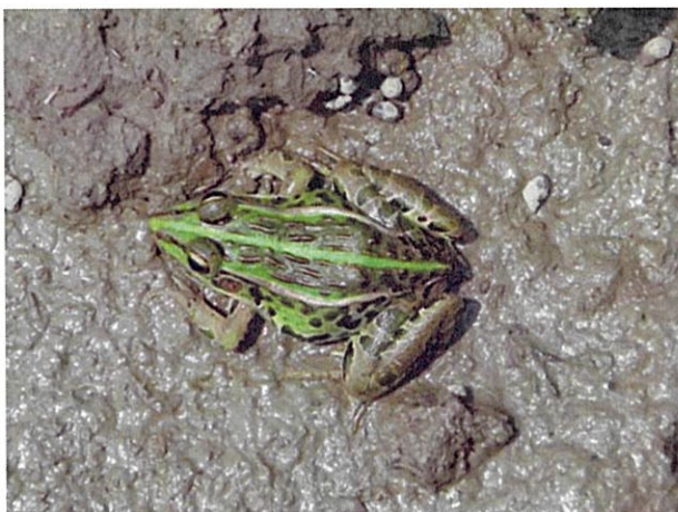
水路で確認されたトノサマガエル