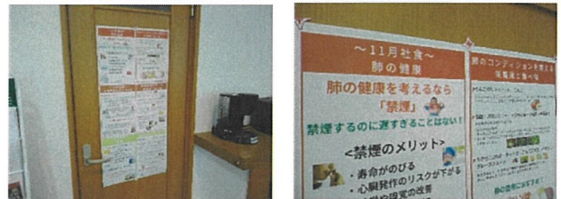
A⑤-2. B⑤. 健康をテーマとした情報提供