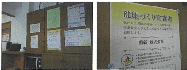
A①. 「健康づくり宣言書」の掲示