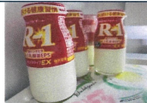
乳酸菌飲料購入者の一部補助