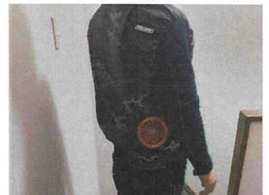
電動ファン対応ウェアの支給