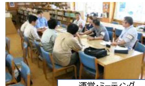
運営・ミーティング