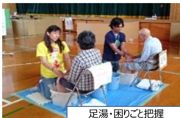
足湯・困りごと把握