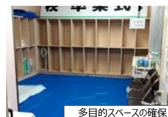
多目的スペースの確保