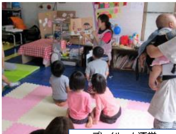
プレイルーム運営