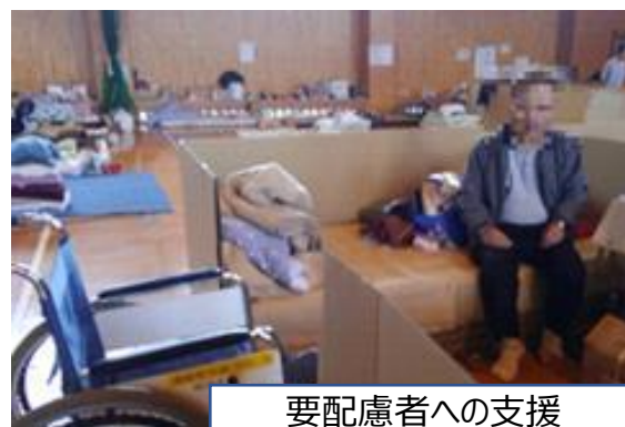
要配慮者への支援