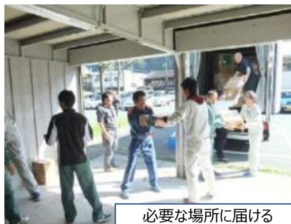
必要な場所に届ける