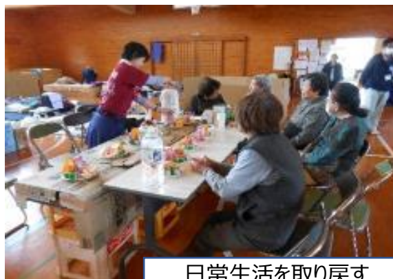
日常生活を取り戻す